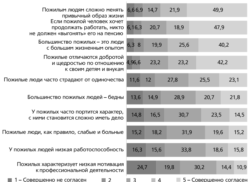
Рис. 1. Степень согласия и несогласия с суждениями о различных аспектах жизнедеятельности пожилых людей, в %

А сниженный возраст выхода на пенсию возможно приводит к тому, что женщины чаще оказываются в ситуации, когда их вынуждают оставить место работы и выйти на пенсию.