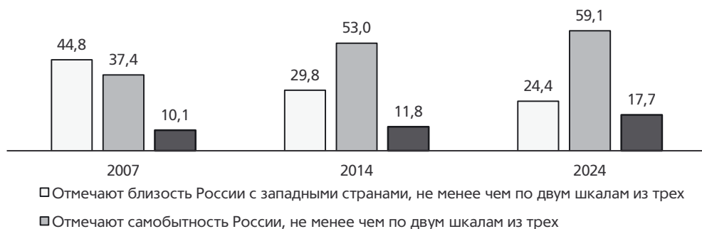
Рис. 4. Динамика согласованности оценок россиян между шкалами цивилизационной близости России со странами Запада или Востока, 2007–2024 гг., % по массиву в целом

Примечание. Прием суммирования показателей к представленным данным не применим, поскольку каждый столбец соответствует проценту, охватывающему долю населения, выбравшего соответствующую идентификацию не менее чем по двум шкалам из трех возможных (по культуре, экономике и национальному характеру).