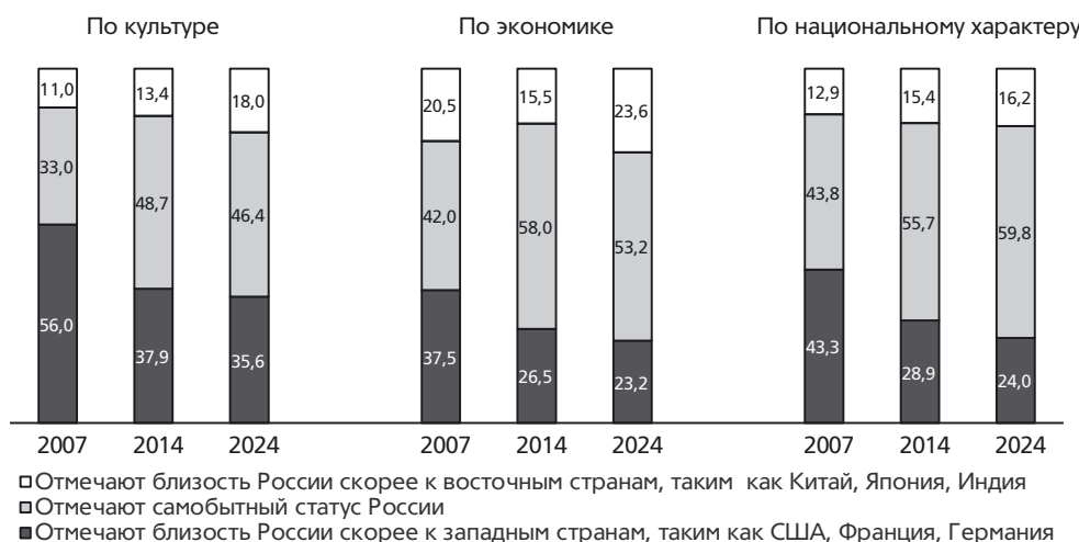
Рис. 3. Динамика оценок цивилизационной близости России со странами Запада или Востока по культурной составляющей, экономике и национальному характеру, 2007–2024 гг., % по массиву в целом

В отношении экономики в общественном сознании сформировались примерно такие же убеждения, связанные прежде всего с пониманием большей частью населения непохожести экономических моделей стран «коллективного Запада» и России. Первоначально казавшаяся привлекательной нашим гражданам модель «свободного капитализма» оказалась слишком болезненной для большинства россиян и потребовала значительных усилий от государства по приданию ей облика, который мог бы хоть отчасти соответствовать