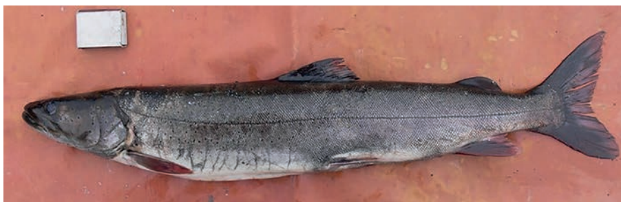
Рис. 3. Неполовозрелый таймень из р. Тимптон (2010 г.).