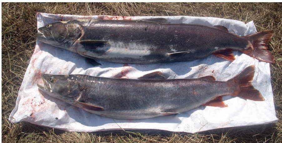
Рис. 2. Внешний вид самцов обыкновенного тайменя в нерестовый период.

Линейные размеры, масса и возраст рыб. Средние размеры и масса тела самок и самцов тайменя на нерестилищах в р. Муна различались незначительно (у самок 107.2 \pm 1 см и 10.7 \pm 0.2 кг соответственно, у самцов – 107.3 \pm 1 см и 10.5 \pm 0.3 кг). Масса их тела в разных возрастных классах также различалась незначительно. Масса тела тайменя из р. Муна была значительно больше, чем у тайменя из верхнего течения реки р. Лена и ее притоков (табл. 2), что, вероятно, связано с большей кормностью нижнего участка р. Лена.