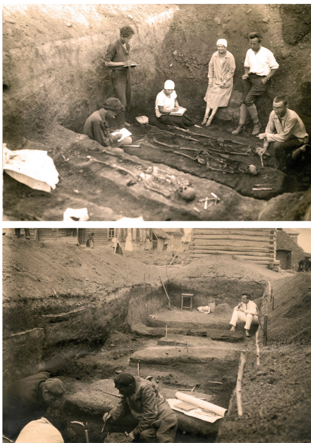
Рис. 4. Раскопки Перемчалкинского могильника. На верхнем фото Б.С. Жуков стоит справа, на нижнем – сидит на заднем плане. Антропологическая комплексная экспедиция, 1926 г.

Этот подход, когда единые методы изучения признавались как для древних, так и для современных культур, делал логичным обращение и к собственно этнологическим исследованиям, и к изучению “ближайших к современности погребенных групп” (рис. 4). Культуры недавнего прошлого ранее никогда не были объектами систематического археологического изучения, они вошли в поле зрения археологов только в русле палеоэтнологического направления и, прежде всего, благодаря работам Жукова и его учеников. Так, совершенно новаторским стало исследование АКЭ волжско-финских могильников XVII–XVIII вв. (Большепольский, Одошнурский, Сарлейский). Борис Сергеевич