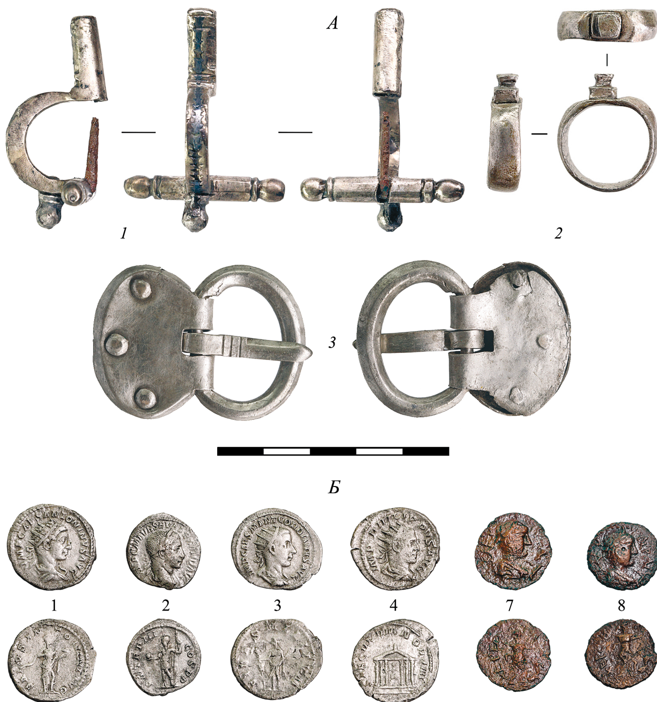
Рис. 3. Серебряные изделия (А) и римские и херсонесские монеты (Б) из погребения римского офицера. А: 1 — фибула; 2 — перстень; 3 — фибула. Б — номера соответствуют списку монет (см. текст).