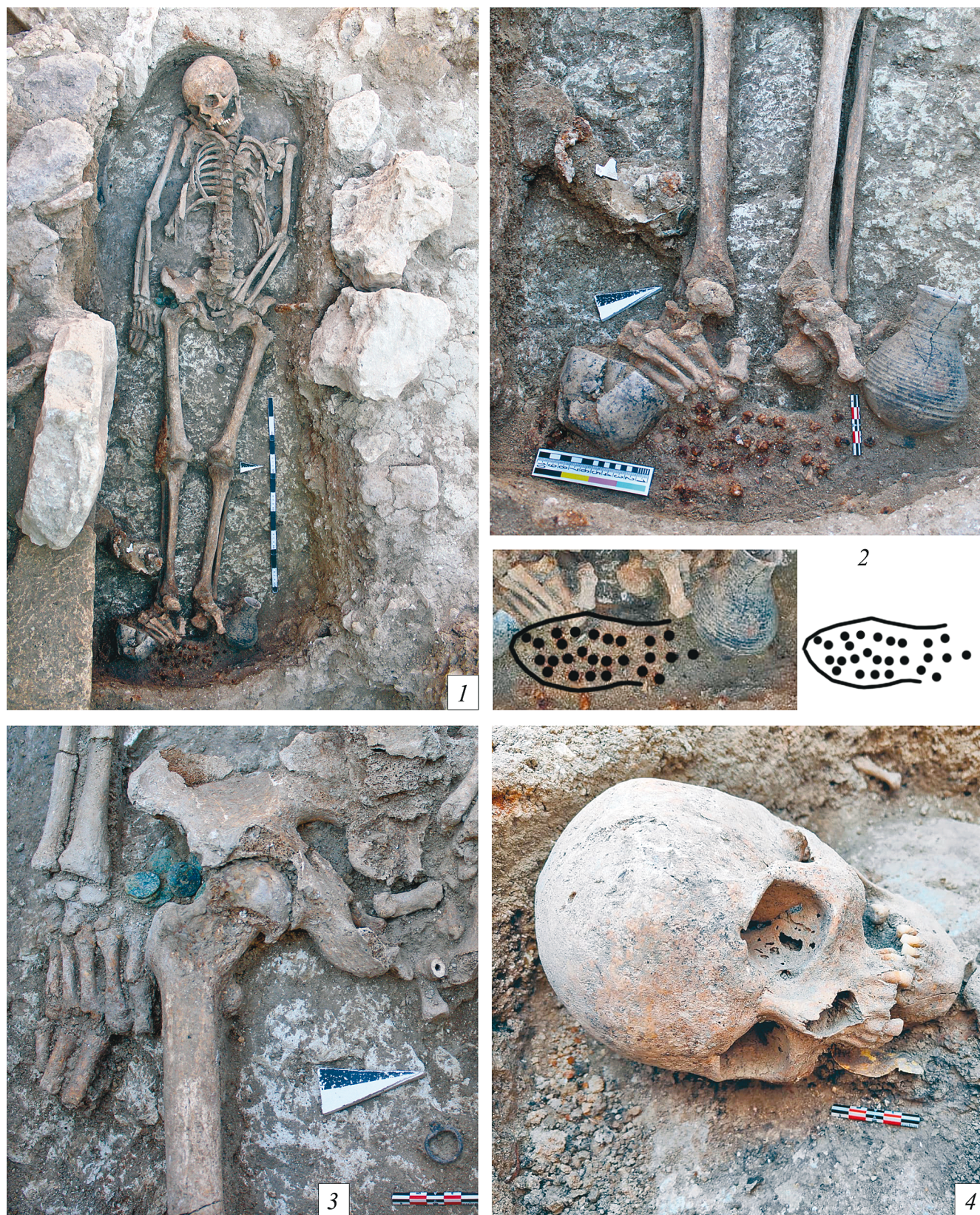
Рис. 1. Погребение римского офицера. 1 – общий вид; 2 – подошва левого сапога-кальцеи; 3 – кошелек и перстень; 4 – золотой нагубник. 2–4 – in situ .