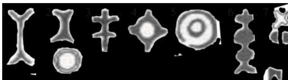
Рис. 3. Клейма на ножах и ножницах, Лондон

ются на английских ножах XIV века [7, р. 22, № 262] (рис. 3. 3) в музее Каствельвеккьо в Вероне хранится миланский меч XVI века с клеймом в виде такой же лилии 8 .