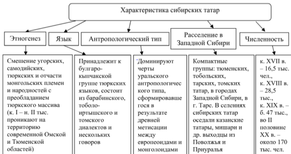
Рис. 2. Этнические особенности сибирских татар

Цель данного проекта – объединить элементы традиционной материальной и духовной культуры сибирских татар: жилые и хозяйственные постройки, ремесла, одежду, кухню, фольклор. Комплекс - место посещения туристов с погружением в национальную среду, что позволяет поддерживать сохранение этнического самосознания у сибирских татар в Омской области.