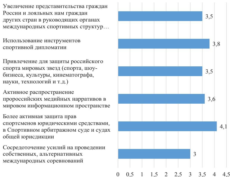
Рис. 2. Экспертная оценка эффективности вариантов противодействия дискриминационной политике в отношении российского спорта (средний балл)

Все эти меры (без деления их на смысловые блоки) также было предложено оценить по пятибалльной системе участникам экспертного опроса. Результаты представлены на рис. 2.