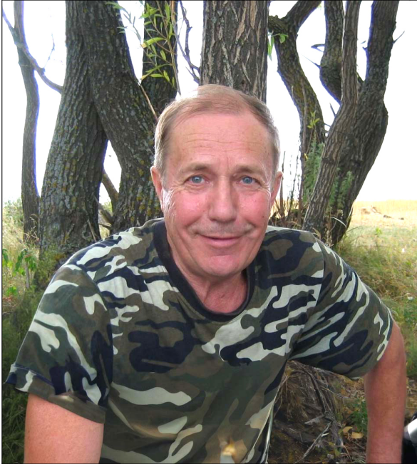
В заволжской степи на привале (2010 г.)