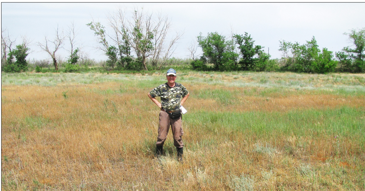
Окраина Дьяковского леса (Заволжье, сентябрь 2022 г.)

геологические объекты» (Саратов: Изд-во Саратовского университета, 2007. 300 с.).