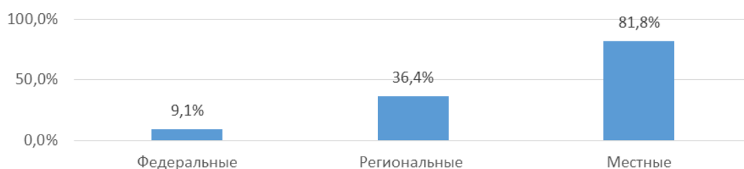
Рис. 1. Взаимодействие ресурсных центров поддержки СО НКО с органами власти различных уровней

СМИ (53 %); муниципальных советах и комиссиях по вопросам образования, добровольчества, поддержки НКО, распределения бюджетных средств, поддержки малого и среднего бизнеса (82 %), включенности в реестр поддержки СО НКО (41 %).