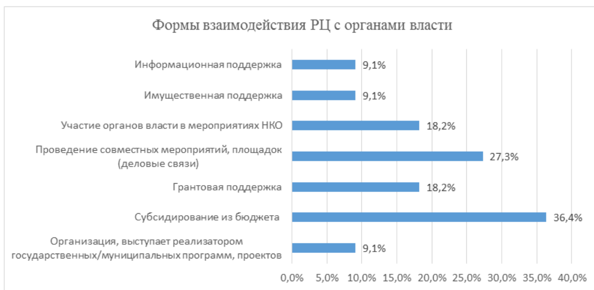
Рис. 2. Формы взаимодействия органов власти и ресурсных центров поддержки СО НКО

В партнерстве органов власти и некоммерческих организаций часто первые занимают патерналистскую позицию, так как оказывают имущественную, финансовую, информационную поддержку ресурсным центрам, но о развитии двухстороннего партнерства все же свидетельствует включенность организаций в качестве исполнителя государственных/муниципальных программ, а также участие органов власти в мероприятиях, проводимых НКО (рис. 2.)