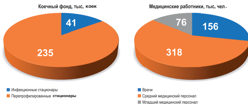
Рис. 3. Количество развернутых коек (тыс. коек) и численность медицинских специалистов (тыс. чел.), участвовавших в борьбе с пандемией COVID-19 в Российской Федерации в 2020г. Fig. 3. The number of beds deployed (thousand beds) and the number of medical specialists (thousand people) who participated in the fight against the COVID-19 pandemic in the Russian Federation in 2020

Проблемы медицинских работников в условиях пандемии заключаются не только в значительном увеличении нагрузки на каждого специалиста, независимо от того, работает он непосредственно с COVID-19 или оказывает помощь иным пациентам в «чистой» зоне – это еще и огромная психологическая нагрузка. Помимо описанных выше трудностей работы в условиях пандемии важно отметить необходимость работы с новыми и часто меняющимися протоколами и требованиями ухода за очень тяжелыми пациентами, состояние которых быстро ухудшается, а также ухода за коллегами, которые заболели, что делает работу врачей и медицинских сестер в подобных условиях близкой к условиям ЧС или боевых действий [14, 15].