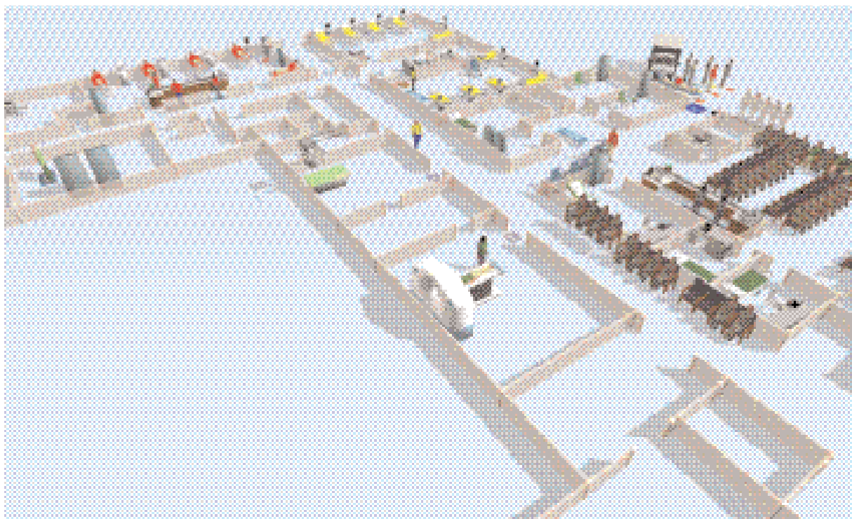
Рис. 2. Модель-1 – стационарное отделение скорой медицинской помощи Первого Санкт-Петербургского государственного медицинского университета им. И.П. Павлова Минздрава России

2. Имитационное моделирование доказало, что наличие СтОСМП в университетской клинике и в многопрофильном стационаре обеспечивает преимущество перед