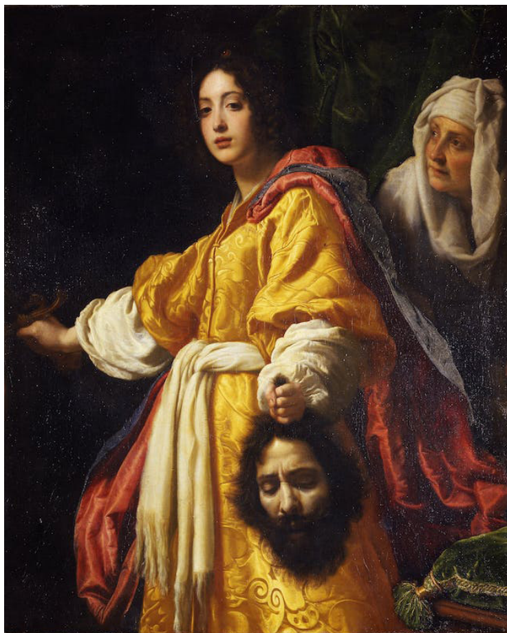
Ил. 2. Кристофано Аллори. Юдифь с головой Олоферна. 1610–1612. Флоренция, Палаццо Питти

держащая в правой руке меч, а в левой – отрубленную голову боро- датого мужчины, а также немолодая женщина рядом; мы можем понять значение (денотацию) этой композиции: Юдифь с головой Олоферна, иллюстрация библейского сюжета. И лишь культур- ный код приводит нас к смыслу (коннотации) этого изображения: праведное возмездие нечестивому (ил. 2).