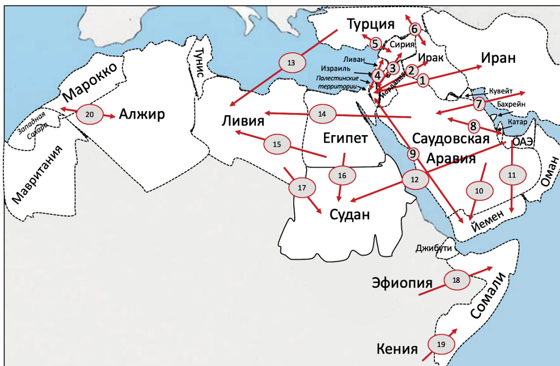
Рис. 2. Линии конфликтов с вовлеченностью региональных акторов в макрорегионе БВСА (без учета векторов влияния нерегиональных акторов):

в кружочках указаны номера конфликтных линий. Линия с одной стрелкой указывает на односторонний вектор конфликтной линии, линия с двумя стрелками — на ее двустороннюю направленность.