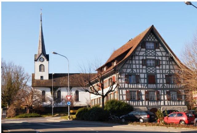
Рис.3 Церковь в Кесвиле, в которой служил отец Юнга

Что собой представляла для Юнга проблемная ситуация. Его занимали две экзистенциальные проблемы. Первая. Взаимоотношения с отцом, потомственным священнослужителем, который по мнению Юнга догматически выполнял свой долг: имея религиозные сомнения, не пытался их разрешить, и вообще был несвободен в отношении христианской веры. Вторая проблема – выстраивание собственных отношений с Богом, уяснение отношения к Церкви. Зная, что Юнг потом сделал, разорвав кардинально с отцом и церковью, мы можем предположить, что еще до первого причастия он хотел разорвать эти отношения, но не мог в этом себе признаться, поскольку такой поступок выглядел бы в глазах верующих (а Юнг, безусловно, к ним принадлежал) кощунственным.