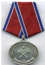
Рис. 1. Медаль «За отвагу на пожаре» - государственная награда СССР (лицевая сторона). Фото находится в свободном доступе в сети интернет.