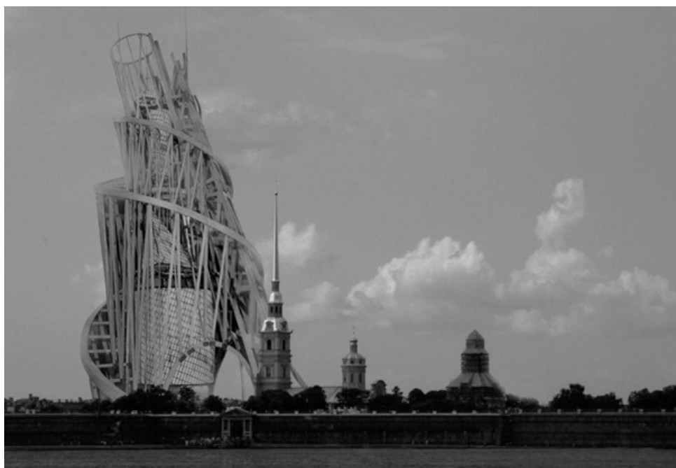
Рис. 1. «Башня Татлина». Проект памятника III Интернационалу, Владимир Татлин, 1919–1920 годы.

отмечает Большакова [3], это была демистификация искусства, переход от репрезентации к реальному конструированию среды. Наиболее полное воплощение этот подход нашел в проекте «Башня Татлина» (1919–1920). Ее спиральная структура из стали и стекла символизировала динамику революции, а вращающиеся геометрические объемы (куб, пирамида, цилиндр, полусфера) функционально разделяли пространства власти. Современные исследователи видят в Башне не просто утопический артефакт, а действующую методологию, синтезирующую революционную форму, технологические возможности эпохи и социальную миссию [10]. Каркасная открытость сооружения, отвергающая фасад как декорацию, стала прообразом «честной» архитектуры, где эстетика рождается непосредственно из утилитарности (рис. 1). «Татлин назвал свое изобретение «Памятником III Коммунистическому Интернационалу», посвятив его не только социальной революции начала XX века, но создав, таким образом, символ революционного переворота в развитии человечества» [10].