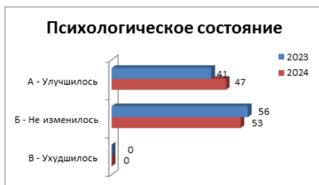
Рис. 3. Психологическое состояние курсантов БЮИ МВД России

В результате проведенного опроса курсантов, принявших участие в анкетировании, получили следующие показатели (рис. 3).