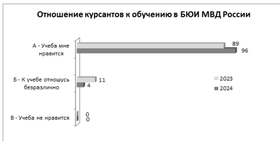
Рис. 1. Отношение курсантов к обучению в БЮИ МВД России.

В результате проведенного опроса курсантов, принявших участие в анкетировании, получили следующие показатели (рис. 1).