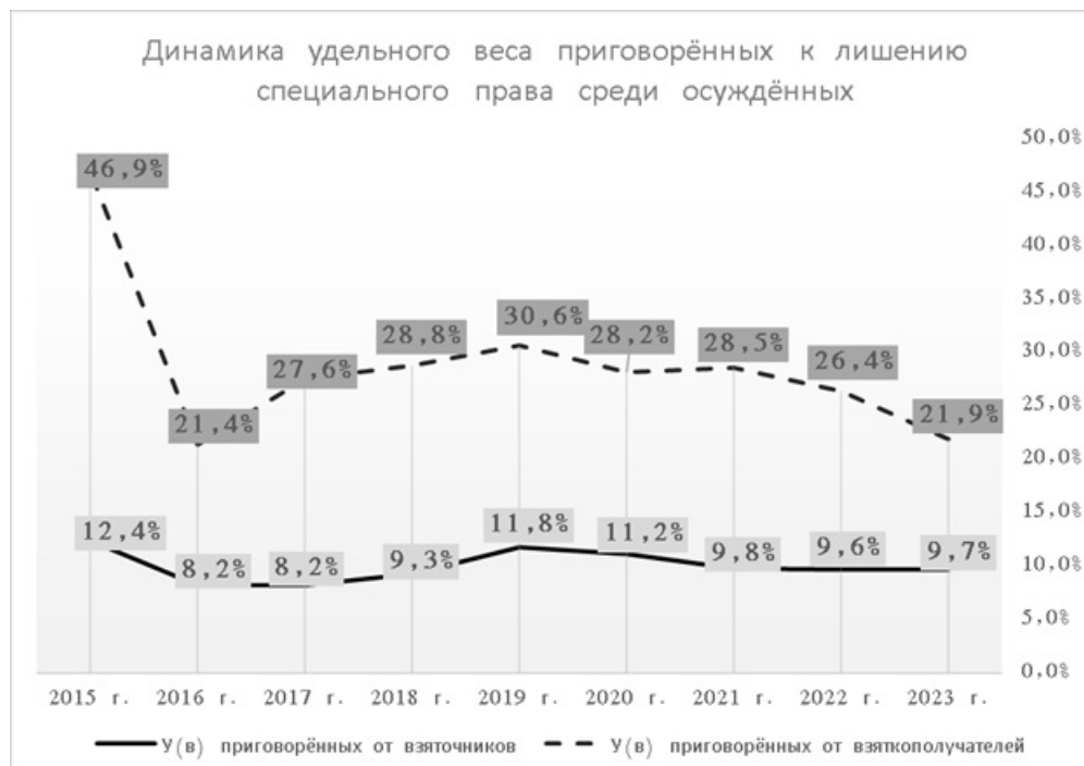
Рис. 3. Динамика лишения специального права.

Понятно, что мера уголовной ответственности связана не только со степенью и характером общественной опасности таких преступлений, но и личностью виновного. Криминологическая характеристика лиц, которым наиболее часто назначается лишение специального права (на примере осуждённых за получение взятки или коммерческого подкупа), по состоянию на 2023 год выглядит следующим образом. В большинстве случаев – мужчины (82,6%) старше двадцати пяти лет, но моложе шестидесяти (97%); граждане России – постоянные жители данной местности (100%); ранее не судимые (99%). По роду деятельности: 36,5% – государственные и муниципальные служащие; 34,3% – сотрудники правоохранительных органов; 21% – служащие коммерческой и иных организаций; 5,6% – военнослужащие. Исходя из приведённых социально-демографических характеристик, вырисовывается типичный портрет хорошо социализированного человека, что, несомненно, влияет на характер назначаемого судом наказания.