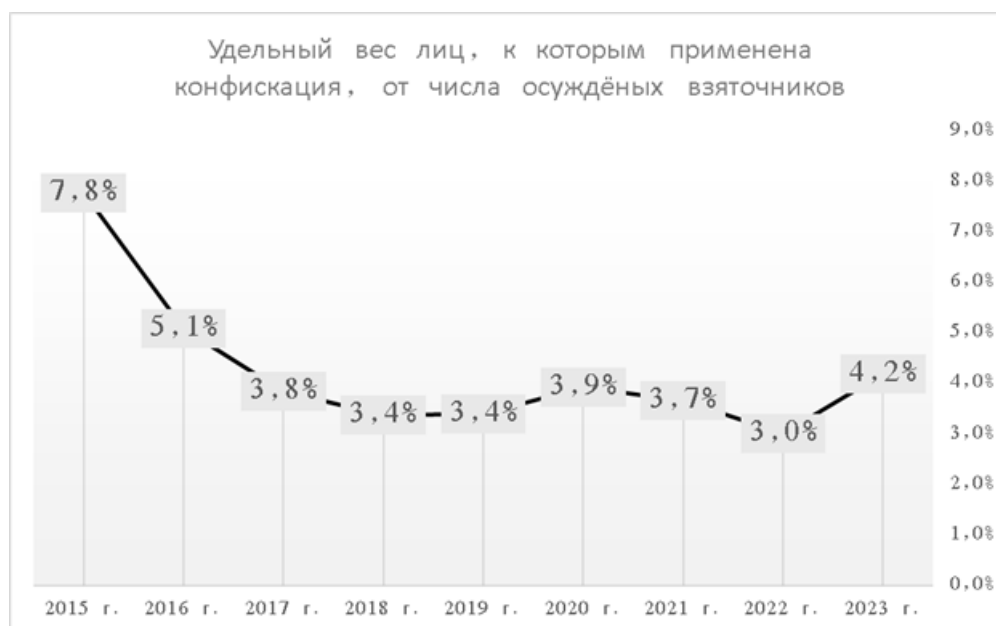
рис. 2. Динамика применения конфискации к осуждённым.

Во многих современных исследованиях по вопросу пенализации коррупционных преступлений предлагается на первое место выдвинуть реальное лишение свободы [3, с. 103] . Фактически предлагается восстановить статус-кво, существовавший в первоначальной редакции УК РФ. Однако строгость санкции ещё не гарантирует превентивный эффект. По мнению С.Ю. Бытко [6, с. 31] , следовало бы учесть, что наибольшим предупредительным потенциалом обладают дополнительные виды наказаний. Имеется виду лишение специального права и в качестве иной уголовно-правовой меры – конфискация имущества.