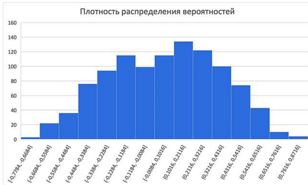
Рисунок 3 – Гистограмма плотности распределения вероятностей успеха полёта отражает статистическое распределение исходов по совокупности всех проведённых испытаний.

На рисунке 3 представлена гистограмма плотности распределения вероятностей успешности полёта, отражающая статистическое распределение исходов по совокупности всех проведённых испытаний. По горизонтальной оси отложено значение рассчитанного показателя успешности полёта, а по вертикальной – плотность (частота) наблюдений данного значения. Распределение имеет выраженную двухмодальную форму. Основной пик сосредоточен в области положительных значений показателя (от 0 до 1), что соответствует успешным полётам. Меньший пик наблюдается в области отрицательных значений, что свидетельствует о частых отказах системы.