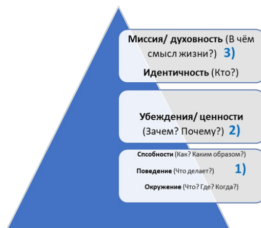
Рисунок 1. Структура логических уровней

Данная взаимосвязь справедлива как для вертикали, отражающей логические уровни, так и для «оси отражения-отреагирования». Реализация этой идеи на практике помогает соотнести объективные требования конкретной ситуации и актуализацию определенных форм внутренней активности субъекта в ней [19, с. 42] .