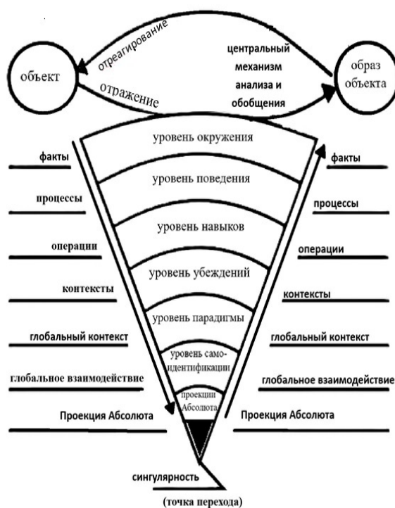
Рисунок 3. Объёмный (трёхмерный) вариант модели Р. Дилтса

Структурная психосоматика и ее техника направлена на развитие целостной личности, которая имеет четкую структуру, обеспечивающую динамичность развития и самоорганизации. Здесь важную роль играет активность самого субъекта, как творческого начала. Иной путь в принципе невозможен. [19, с. 9]