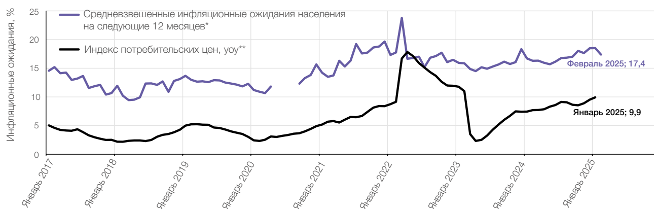
Рис. 1. Динамика инфляции и инфляционных ожиданий населения РФ (источники: * результаты опросов населения ООО «инФОМ», ** данные Росстата)

Неспециалисты меньше обращаются к опубликованным официальным материалам, нежели профессиональные участники рынка. В связи с этим Банк России активно развивает свое присутствие в соцсетях (телеграм-канал Банка России, Rutube,