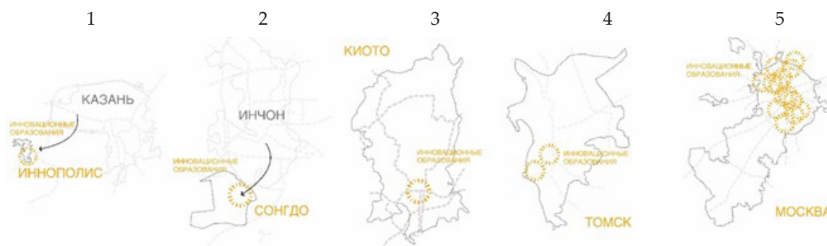
Рис. 2. Пример различных вариантов интеллектуализации сложившихся городов: 1 – Иннополис – пример опосредованной интеллектуализации Казани; 2 – Сонгдо – пример опосредованной интеллектуализации Инчона; 3 – Киото – пример локальной интеллектуализации; 4 – Томск – пример интегрированной интеллектуализации; 5 – Москва – пример распространенной интеллектуализации

Таким образом, признаки интегрированной интеллектуализации в Москве также наблюдаются. Но всё же о принятом курсе на распространённую интеллектуализацию свидетельствуют заявленные стратегические направления развития Москвы как «умного города». Вышесказанное объясняет то, почему Москва занимает 38-е место из 500 «умных городов» в глобальном индексе инновационных городов мира международного австралийского агентства 2thinknow (Innovation Cities Global Index 2019). Для сравнения Санкт-Петербург находится на 109-м, Казань – на 393-м, а Самара – на 440-м месте [6]. В то же время по рейтингу Минстроя 2020 г., определившему индекс цифровизации городского хозяйства «IQ городов», из 191 российского города Казань занима-