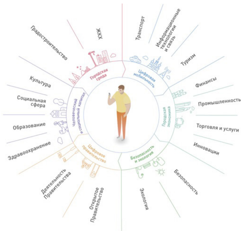
Рис. 3. Направления развития умного города из стратегии Москва – «Умный город –2030» как выражение курса на распространенную интеллектуализацию, когда практически каждой отрасли экономики соответствует свой ИНГСО, в пределах традиционного города формируется инфраструктура территории инноваций

ет 2-е место, расположившись между Москвой и Санкт-Петербургом. Самара по данным Минстроя находится на 9-м месте [7].