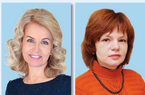
Т.В. КУЗЬМИЧЕВА, Ю.А. АФОНЬКИНА*

DOI: 10.22204/2587-8956-2023-114-03-61-71