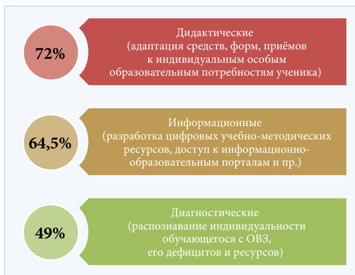
Рис. 2. Методические затруднения педагогов в сфере индивидуализации образовательного процесса

Диагностическая методика образовательного события предполагала анализ и интерпретацию составленных педагогами описаний реальных ситуаций, связанных с их профессиональными затруднениями в организации обучения и воспитания ребёнка с ОВЗ, иначе говоря, конкретных случаев. Педагогу сообщалась следующая инструкция: «Опишите не менее трёх примеров конкретных случаев, отражающих проблемы Вашего профессионального взаимодействия с обучающимся с ОВЗ на уроке, разрешение которых для Вас составило трудность. Попробуйте объяснить, почему проблемы для Вас оказались сложно разрешимыми».