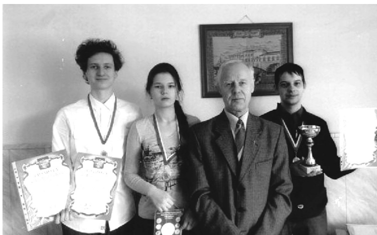
Рис. 3. Сборная университета по шахматам, победитель Всероссийского турнира среди медицинских вузов